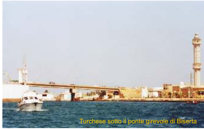
Turchese sotto il ponte girevole di Biserta

Egadi avevamo doppiato Pantelleria, per saltare a Kelibia, risalire la costa tunisina sino ai confini algerini per far rotta su Villasimius, facendo tappa in La Galite. risalire le coste