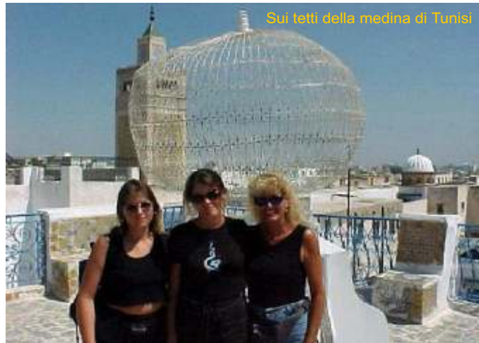
Sui tetti della medina di Tunisi